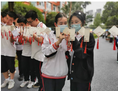
5月26日，四川师范大学附属中学高三学生参加学校组织的心理健康关爱活动。

丹东市今年共设9个考区、三类考点，其中备用考点内的120个备用考场，供已治愈出院的确诊病例和无症状尚在随访期的考生、密接及次密接考生、封