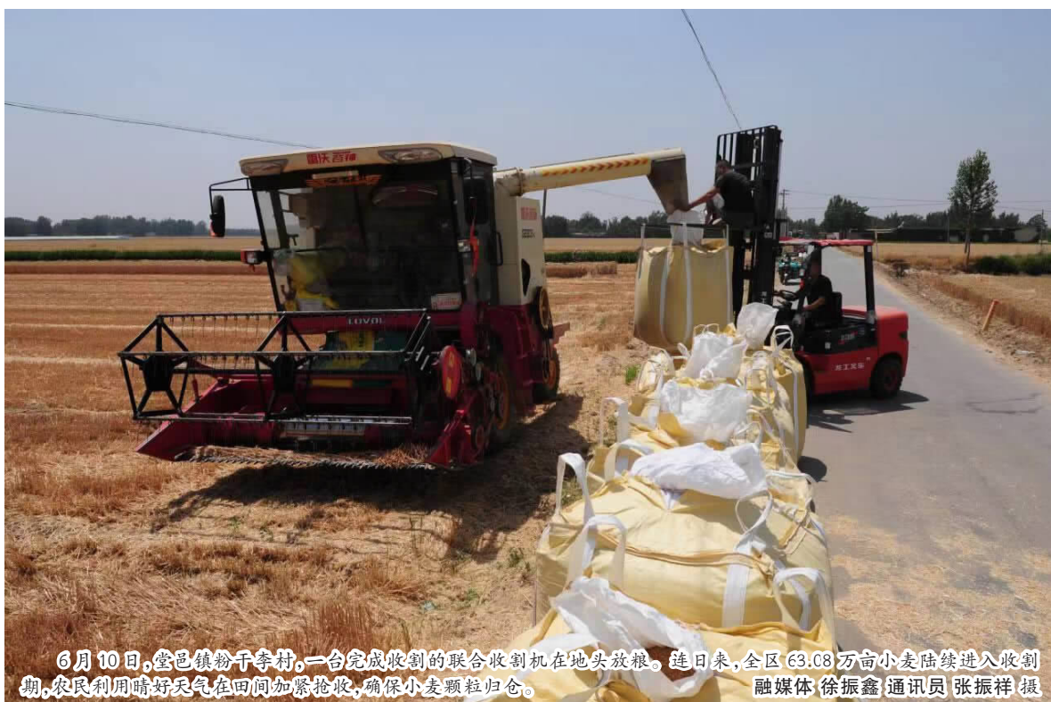
6月10日,堂邑镇粉干李村,一台完成收割的联合收割机在地头放粮。连日来,全区63.08万亩小麦陆续进入收割期,农民利用晴好天气在田间加紧抢收,确保小安颗粒归仓。