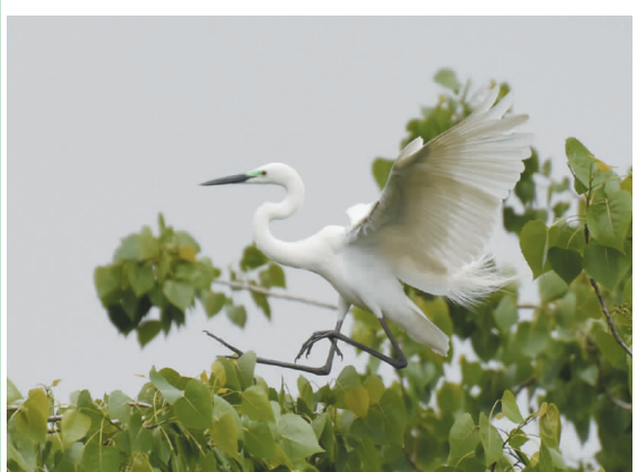
鹭舞枝头

暮秋时节，冬天的影子若隐若现 落叶，诉说着那些过去 顺着目光，一次次进入荒凉 成群的大雁，向着更远的南方迁徙 恋恋不舍地样子，多像是对那个逝去的秋日 是啊，一切都会结束 而一切也会再次开始，暮秋 站在秋天的末尾和冬天的开头 承前启后地抒情或叙述